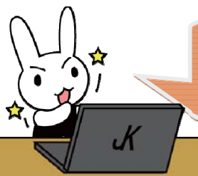
JapanKnowledge マスコット ジャッキーくん